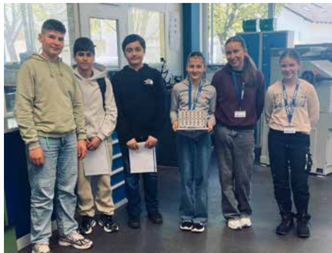
Girls' und Boys' Day bei Berger Ottobeuren

Unter dem Motto „Es zählt, was du willst“ beteiligte sich die Berger Gruppe auch in diesem Jahr am bundesweiten Girls' und Boys' Day. Am 23. April öffneten die deutschen Berger Werke in Memmingen, Ottobeuren und Wertach ihre Türen für Schülerinnen und Schüler, die einen Einblick in verschiedene Berufsfelder gewinnen konnten.