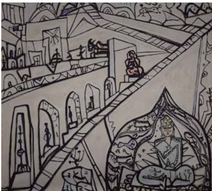
Diether Kunerth, Indien 101, 125 x 125 cm, Acryl auf Leinwand, 1993

Bis 31.03.2025: Do & Fr 11 – 16 Uhr Sa & So 12 – 17 Uhr 01.04. bis 04.05.2025 Di – Fr 11 – 16 Uhr Sa & So 12 – 17 Uhr