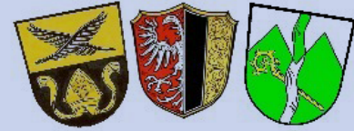
Verwaltungsgemeinschaft Ottobeuren Hawangen - Ottobeuren - Böhen

Die Verwaltungsgemeinschaft Ottobeuren sucht für den