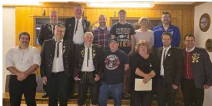
Die neu gewählte Vorstandschaft

Hierbei wurde auch das anstehende Kaffeekränzchen beschlossen, das am Sonntag, 26. Januar ab 14 Uhr für jedermann im Schützenheim in Wolferts stattfindet. Die Vorstandschaft freut sich auf viele Besucher.