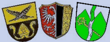
Verwaltungsgemeinschaft Ottobeuren Hawangen - Ottobeuren - Böhen

Die Verwaltungsgemeinschaft Ottobeuren (ca. 10.000 Einwohner) sucht zum nächstmöglichen Zeitpunkt einen