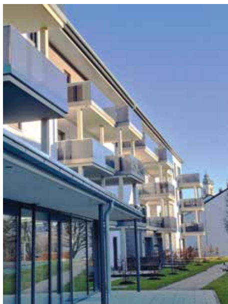
Das Projekt „Lebensräume für Jung und Alt“ in Nachbarschaft zum Altenheim St. Josef wurde eingeweiht.

Nach einem Konzept der Stiftung Liebenau soll es jungen und alten Menschen und mit Handicap eine Gemeinschaft bieten. Zur Feier im Gemeinschaftsraum, der für allerlei Veranstaltungen zur Verfügung