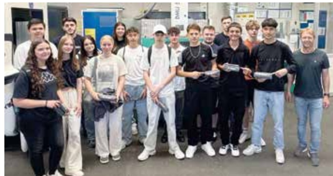
Besuch der 8. und 9. Klassen der Mittelschule bei Berger

Die Mittelschule Ottobeuren besuchte Berger am Standort Ottobeuren mit 13 Schülerinnen und Schülern der 8. und 9. Klassen. Im Rahmen der Berufsoffensive der Mittelschule Ottobeuren erhielten die Jugendlichen eine informative Präsentation über die Firma Berger und deren vielfältige Ausbildungsmöglichkeiten. Ein spannender Betriebsrundgang rundete den lehrreichen Tag ab.