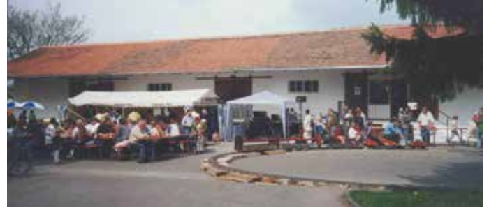
Das Bild zeigt eines der ersten Bahnhofsfeste.

30. September 1996. Danach kam die endgültige Stilllegung der Bahnstrecke. Heute ist die alte Bahnstrecke ein schöner Radweg durchs Günztal und wird von den Touristen sehr gut angenommen. Die Veranstaltung beginnt am Samstag um 14 Uhr, am Sonntag um 10 Uhr und endet an beiden Tagen jeweils um 18 Uhr. Für Kaffee und Kuchen, Getränke, Steaks und Bockwurst ist gesorgt.