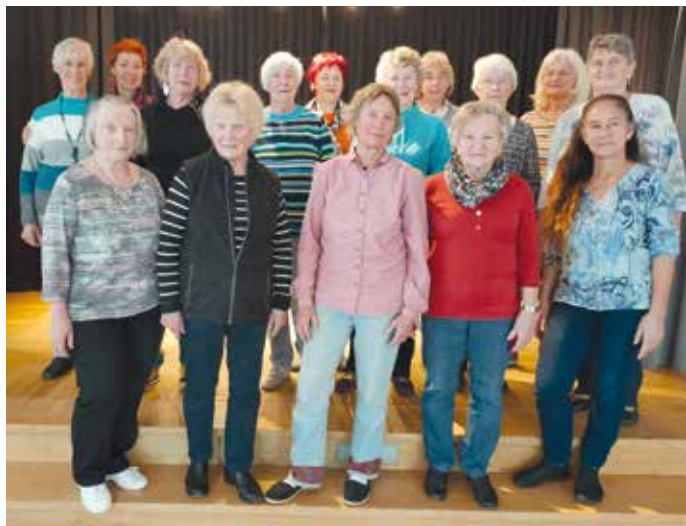
Kneipp-Gymnastik-Gruppe – Galdy unterwegs

Wer Freude an Musik und Bewegung hat, ist dort herzlich willkommen.