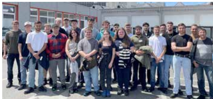
Die Berger Azubis zu Besuch bei Firma Wieland in Vöhringen

äußerst gelungener Ausflug, der sowohl lehrreiche als auch unterhaltsame Elemente vereinte.