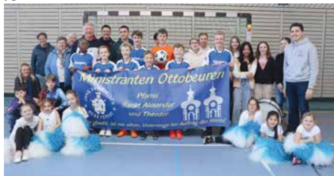
Das Foto zeigt die Ottobeurer Spieler, Fans und Cheerleader mit ihrem Banner